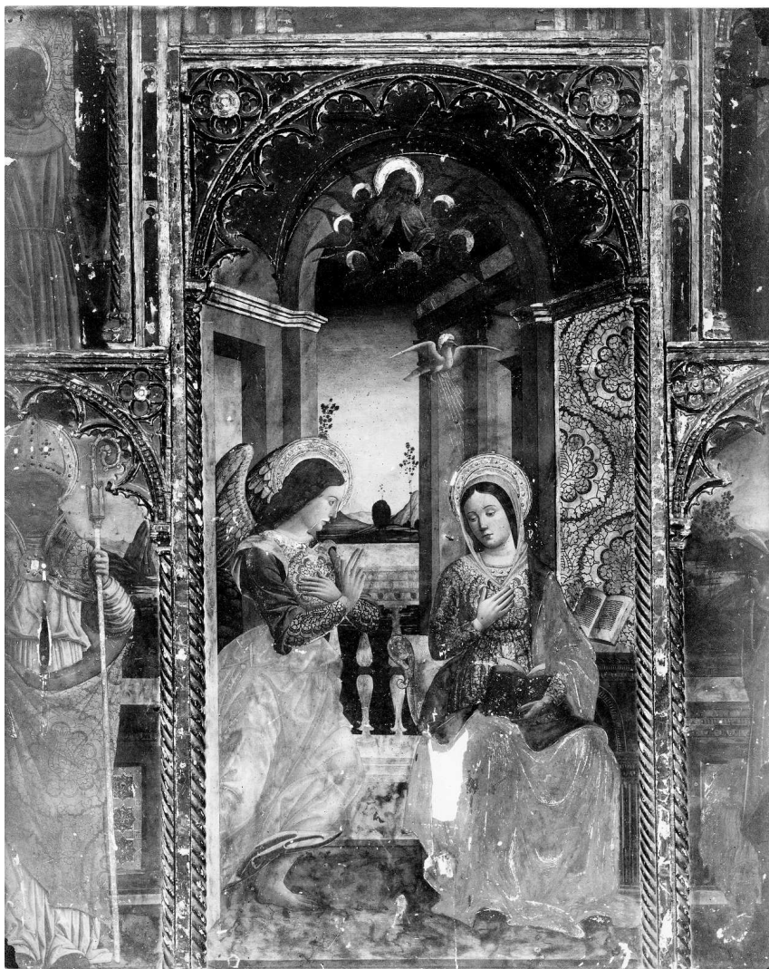
Savona, Museo Civico, pittura di Giov. Mazone, parte centrale.

Fig. 2 - Giovanni Mazone e Maestro di San Lorenzo a Cogorno (Antonio Mazone?), An-nunziatazione , polittico Pozzobonello, Savona, Musei Civici, prima del restauro di Venceslao Bigoni.