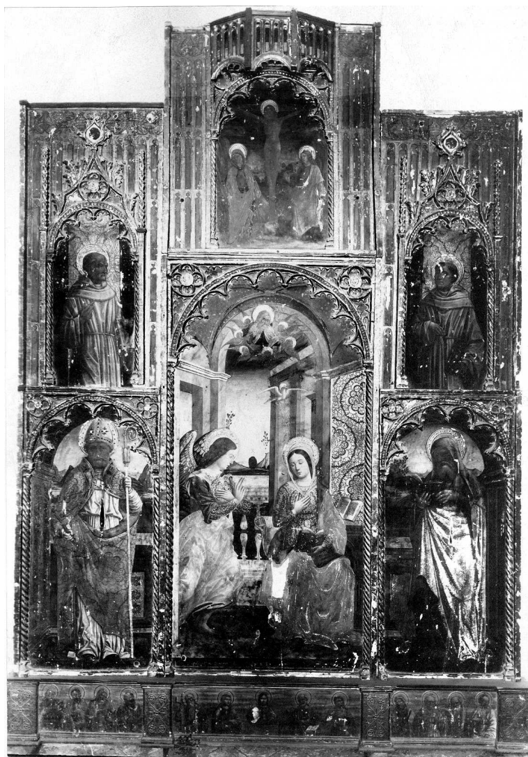
Savona, Museo Civico, pittura di Gio. Mazone.

Fig. 1 - Giovanni Mazone e Maestro di San Lorenzo a Cogorno (Antonio Mazone?), polittico Pozzobonello, Savona, Musei Civici, prima del restauro di Venceslao Bigoni.