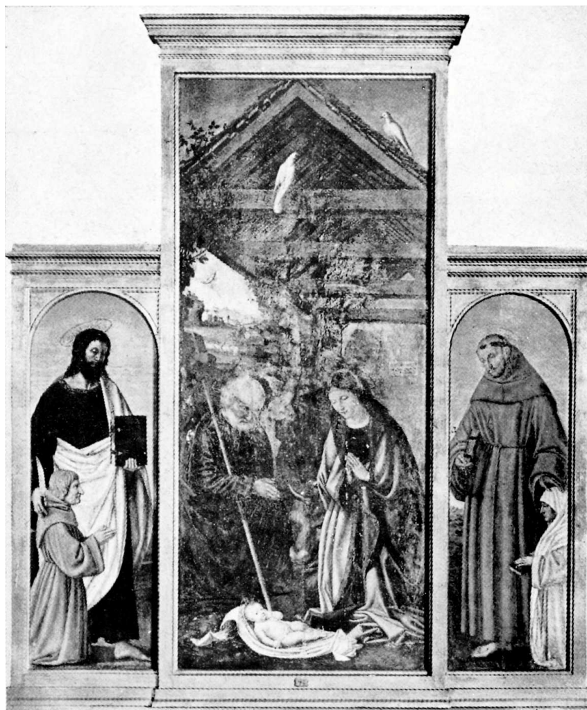
Sala II - FRATE GIROLAMO da BRESCIA (Sec. XVI) La Natività

Fig. 5 - fra' Girolamo da Brescia, Natività con i Santi Bartolomeo e Francesco d'Assisi , Savona, Musei Civici (da P. POGGI, Catalogo della Pinacoteca Civica di Savona , Savona 1938), dopo il restauro di Venceslao Bigoni.